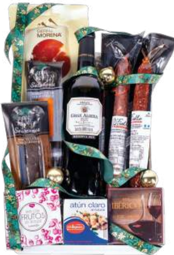
Estuche 706 25,84 € + I.V.A.