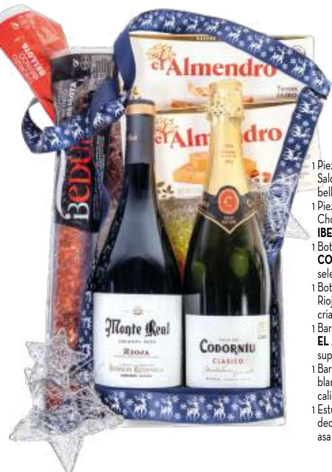
Estuche 707 27,92 € + I.V.A.