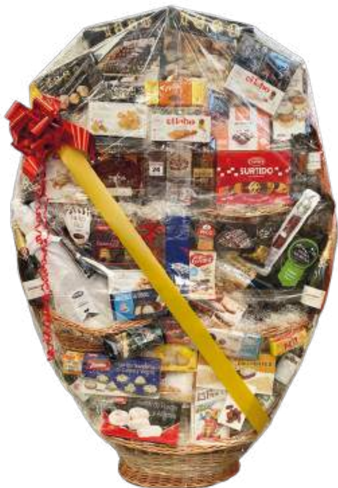
Muestra únicamente de presentación de la Cesta XXL, no de productos