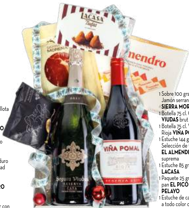
Estuche 708 29,89 € + I.V.A.